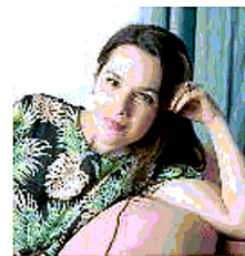
Melissa Panarello, 35 anni